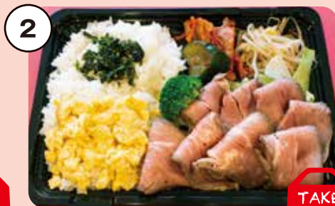
2 ローストビーフ弁当 やわらかローストビーフが大人気! 1,000円