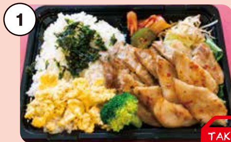
1 トントロ&豚ロース弁当 豚肉好きの方にオススメ! 850円