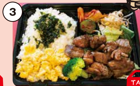
3 黒毛和牛中落カルビ弁当 肉汁たっぷり一ロカルビ! 1,300円