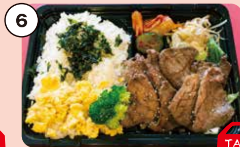
6 牛タン弁当 朱々一番人気の牛タン弁当!! 1,400円