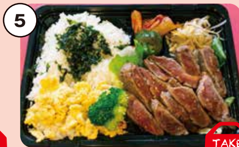
5 イチボステーキ弁当 希少な肉。赤身でサッパリ!! 1,000円