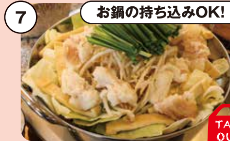
7 お鍋の持ち込みOK! お持ち帰り 京もつ鍋 1人前 おうちで火にかけるだけ! 1,380円