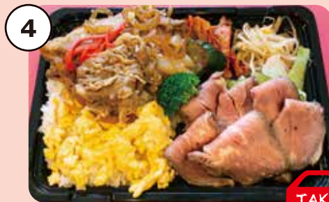
4 牛すき&ローストビーフ弁当 ボリュームたっぷり! 1,200円